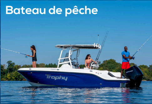
Bateau de pêche